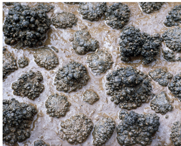
Abb. 1: Eine Meeresbodenprobe mit aufliegenden Manganknollen (untere Bildkante: 40 cm), Wassertiefe: 4400 m.

Der Artikel konzentriert sich auf die marinen mineralischen Rohstoffe, die in Wassertiefen jenseits von 1000 m auftreten, häufig außerhalb der nationalen Hoheitsgebiete. Küstennah vorkommende Phosphorite, Sande und Kiese sowie Schwermineralanreicherungen sind nicht Gegenstand dieses Beitrags.