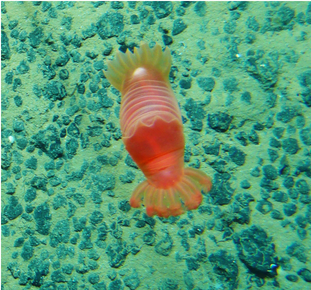
Abb. 6: Seegurke Peniagone leander über Manganknollenfeld im deutschen Lizenzgebiet

Rückstand durch den Abbau aufgrund der erhöhten Strömungsgeschwindigkeit und dem Auftrieb von Wassermassen im Bereich der Seamounts vergleichsweise weit verdriften und gegebenenfalls auch in höhere Wasserschichten gelangen.