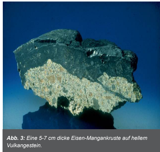
Abb. 3: Eine 5-7 cm dicke Eisen-Mangankruste auf hellem Vulkangestein.

bedeckten Tiefsee-Ebenen aller Ozeane in 4000 bis 6000 m Wassertiefe durch die Ausfällung von Mangan- und Eisenoxiden sowie zahlreichen Neben- und Spurenmitteln aus dem Meerwasser und dem Porenwasser des Sediments. Der sehr langsame Größenzuwachs liegt zwischen 2 und 100 mm/Mio. Jahre. Das größte und wirtschaftlich wichtigste Vorkommen befindet sich im äquatornahen Nordpazifik im sogenannten Manganknollengürtel zwischen Hawaii und Mexiko (Abb. 2). Weitere bedeutende Vorkommen liegen im Perubecken im Südpazifik und im zentralen Indischen Ozean. Der Manganknollengürtel wird von den Clarion- und Clipperton-Bruchzonen begrenzt und ist mit knapp 5 Mio. km 2 etwas größer als die Gesamtfläche der Länder der Europäischen Union. Hier sind gebietsweise 60% des Meeresbodens mit Manganknollen bedeckt und die Be-