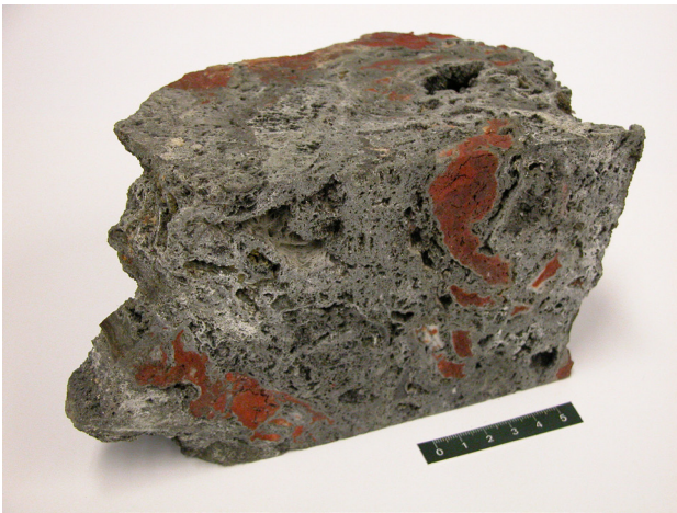
Abb. 4: Massivsulfidprobe aus dem Indischen Ozean mit hohem Kupfergehalt.

schnittlichen Konzentrationen in der Erdkruste beträgt bis zu Faktor 10.000 (Tellur). Neben Kobalt wird der Gewinnung von Tellur aus den Eisen-Mangankrusten das größte wirtschaftliche Potenzial beigemessen. Kobalt wird im Rahmen neuer Technologien vor allem in Batterien von Hybrid- und Elektroautos benötigt, Tellur wird für Kadmium-Tellur-Legierungen in der Dünnschichtphotovoltaik und für Wismut-Tellur-Legierungen in Computerchips eingesetzt.